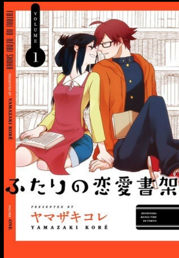
ふたりの恋愛書架