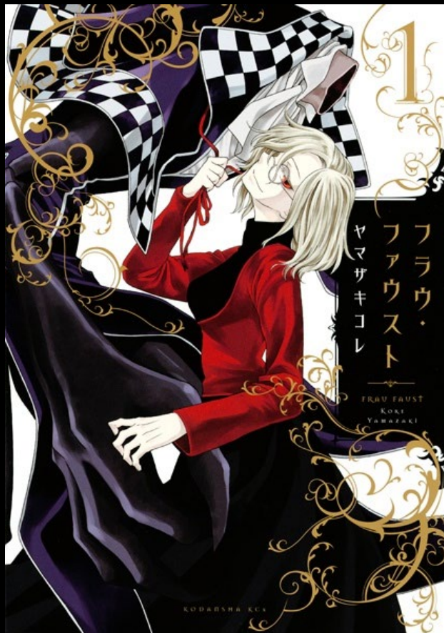
フラウ・ファウスト